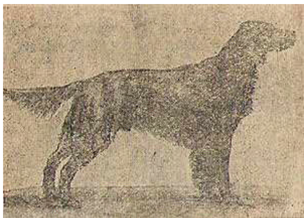
Чемп. «Дик». Представитель старо-ирландского типа.

Упомянув о различии в типах ирландских сеттеров, необходимо сказать несколько слов и о различии стиля работы того и другого.