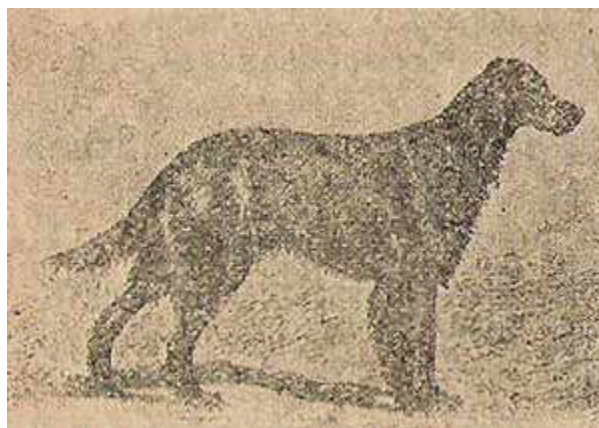
«Жеральдин» О'Калагана. Сука англезированного типа

Ирландский сеттер старого типа идет в поле длинным «волчьим махом», другими словами, удлинённым, плавным броском, объясняемым конструкцией его сложки. Движения его пера энергичны и плавны. Ирландский же сеттер англезированного типа работает «пойнтеринным ходом», его броски могучи, но короче, движения пера интенсивны и часты, как у пойнтера.